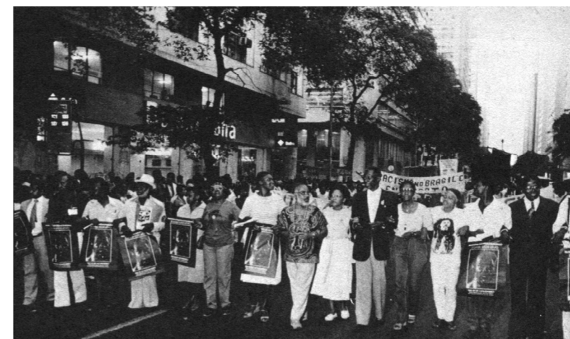
Marcha contra o racismo: Zumbi está vivo!

Parte importante da missão parlamentar que Abdias Nascimento assumiu era dar visibilidade e repercussão às iniciativas do movimento social, trazendo seus temas e suas proposições ao debate do Congresso Nacional. Com bastante frequência, seus pronunciamentos e projetos de lei registram essas iniciativas e proposições, abrangendo uma ampla gama de vozes e entidades negras desde a década de 1930 até o final do século XX. Várias demandas e propostas do movimento negro, como a criação do Dia Nacional da Consciência Negra, chegaram à Câmara dos Deputados por meio da atuação de Abdias Nascimento durante a 47ª legislatura, anterior à Assembleia Nacional Constituinte. O deputado citava e transcrevia as ações e posições das entidades e lideranças do movimento social quando introduzia e defendia essas medidas no Congresso Nacional.