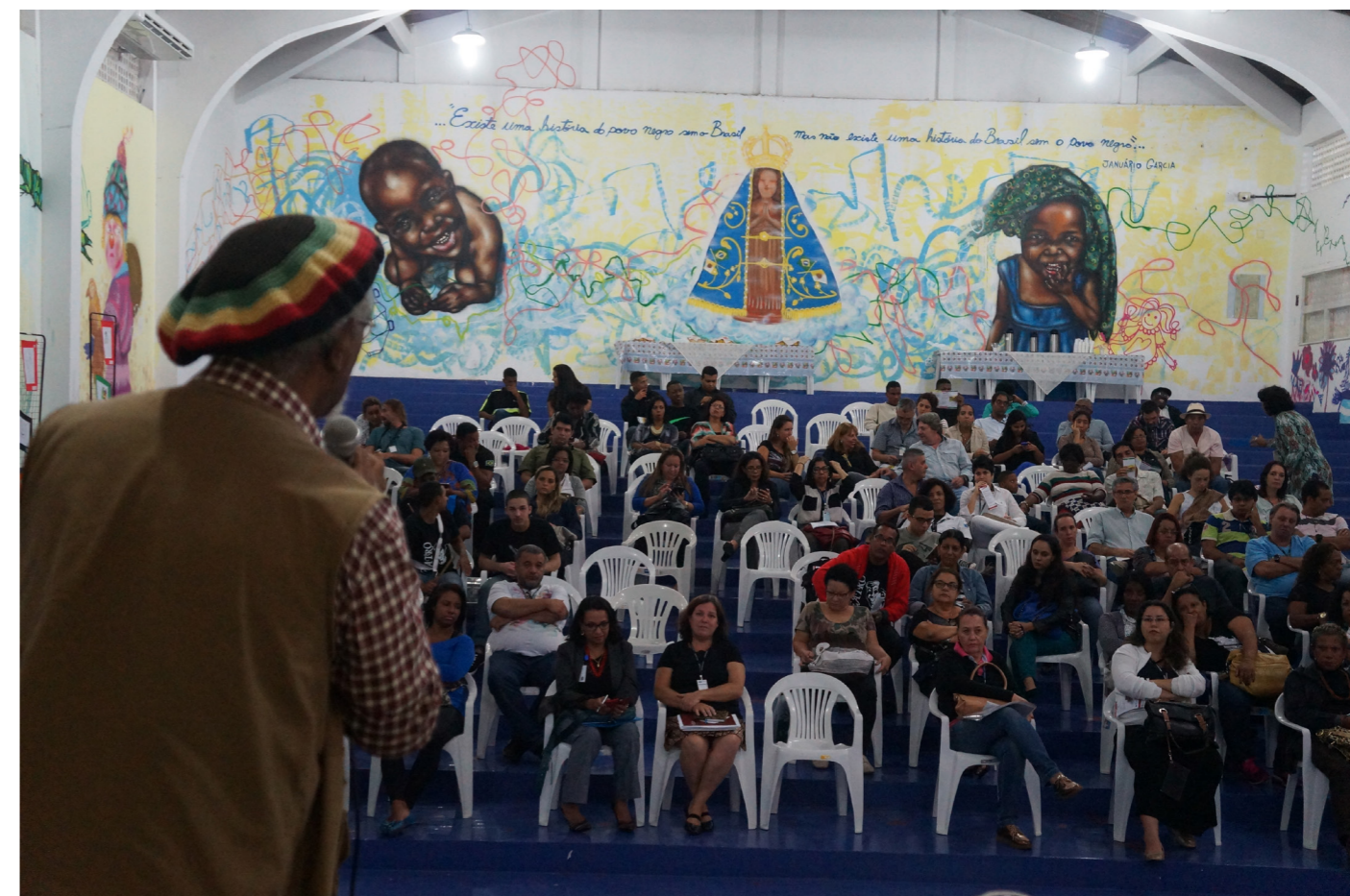
Lançamento do NEAB-ND na Escola João Luis Alves (13/05/15)